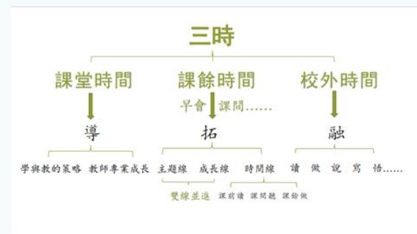
連繫課堂內外學習