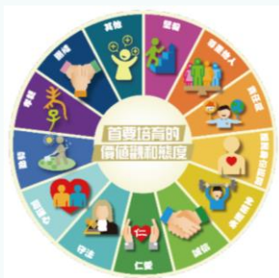
首要培育的價值觀和態度