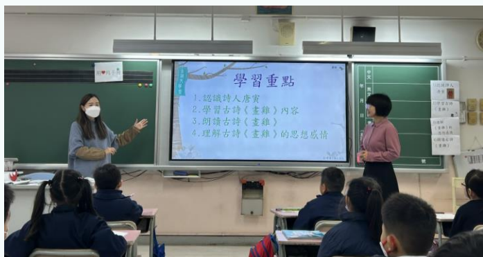
訂立適切的學習重點